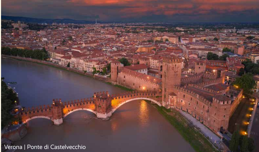
Verona | Ponte di Castelvecchio