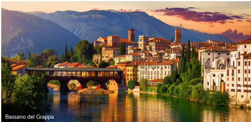
Bassano del Grappa

Im Anschluss Abfahrt in Richtung Udine. Dort Freizeit zum Bummeln oder individuellen Mittagessen. Udine ist eine charmante Stadt im Herzen Friauls, geprägt von venezianischer Architektur, lebendigen Plätzen und gemütlichen Arkadengassen. Rund um die historische Altstadt laden kleine Cafés und Weinstuben zum Verweilen ein, während Sehenswürdigkeiten wie die Loggia del Lionello einen schönen Einblick in die Geschichte der Region geben. Nach dem Stadtbummel begeben wir uns allmählich auf die Heimreise. Am späteren Abend Rückkunft nach OÖ.